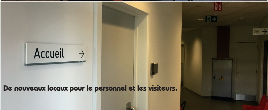
De nouveaux locaux pour le personnel et les visiteurs.