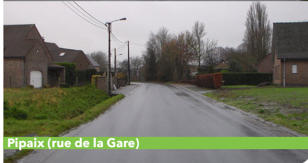
Pipaix (rue de la Gare)