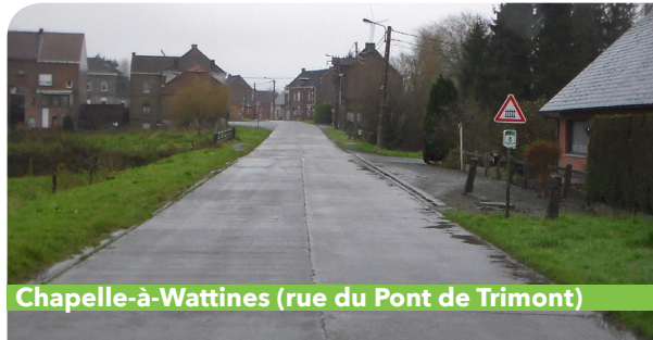
Chapelle-à-Wattines (rue du Pont de Trimont)

Des chicanes, ce sont ces dispositifs qui créent une réduction de la largeur de la chaussée à quatre mètres, obligeant les voitures à céder tour à tour le passage à leur vis-à-vis. Elles sont généralement matérialisées par des marquages au sol et par un dispositif en dur, bien souvent des poteaux ou des bacs à fleurs. « Les chicanes ont l'avantage de ne pas générer