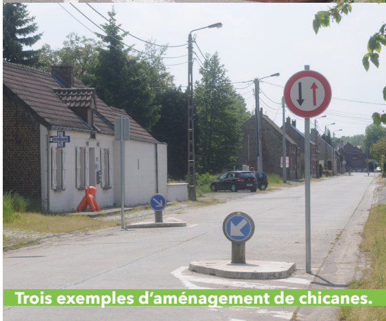
Trois exemples d'aménagement de chicanes.