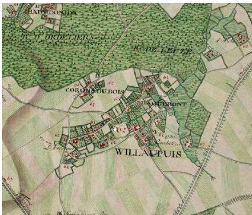
Carte 1 : Carte de Ferraris, village de Willaupuis