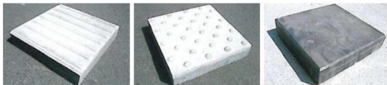
(a) la dalle de guidage (b) la dalle d'éveil à la vigilance (c) la dalle d'information

Au droit des traversées piétonnes, afin d'assurer le guidage et la sécurité des personnes qui ont une déficience visuelle, les trottoirs seront munis de dalles de repérage. Plusieurs types de dalles existent et ont des buts bien précis (orientation, éveil à la vigilance, etc.).